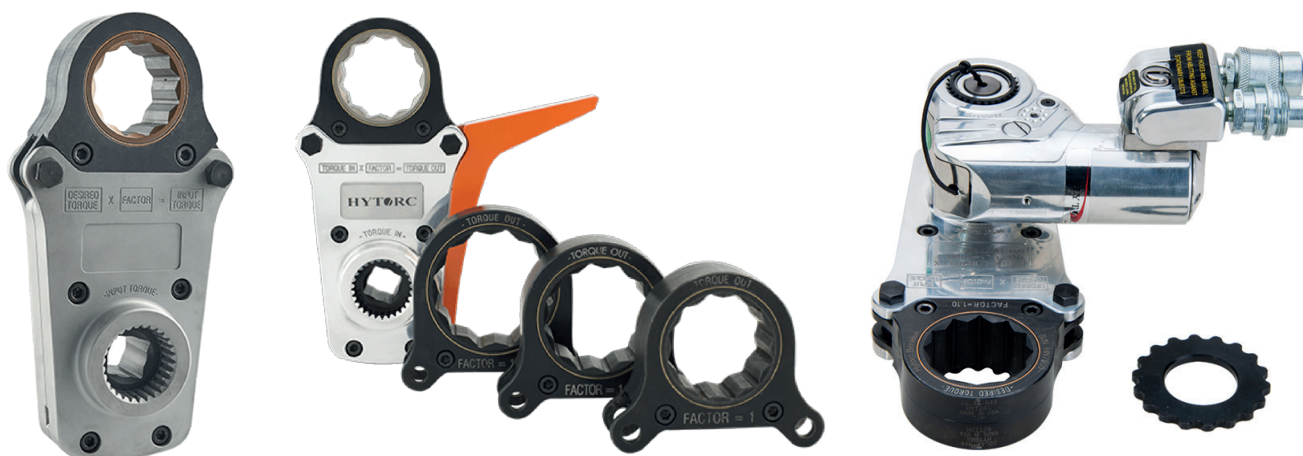
Cartouche de déport pour J-GUN A0.5, A1, AVANTI 1, ICE 1, Lion 0.7, BTM-0700, BTM-1000, LST-0700, 1200.