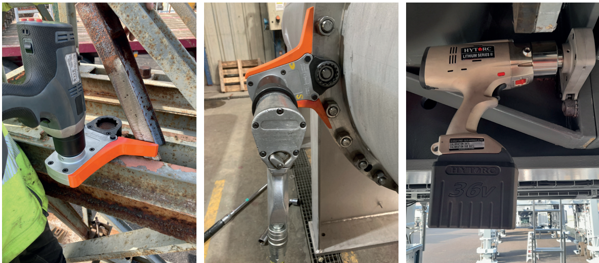
Cartouche de déport pour J-GUN A3, AVANTI 3, ICE 3, BTM-2000 et 3000, LST-2000, 3000 et 5000.