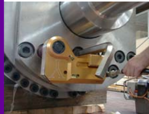
Série « Y »