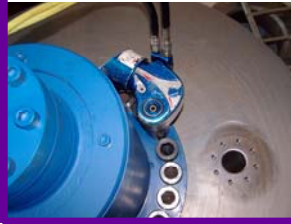
Série « MXT »