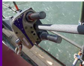
Série « STEALTH »