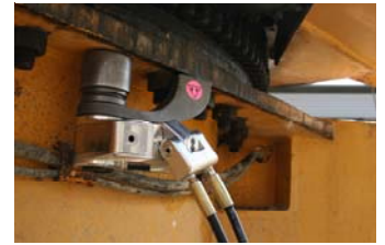
Série « AVANTI »