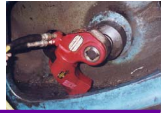
Série « SQV »