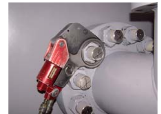
Série « XLCT »